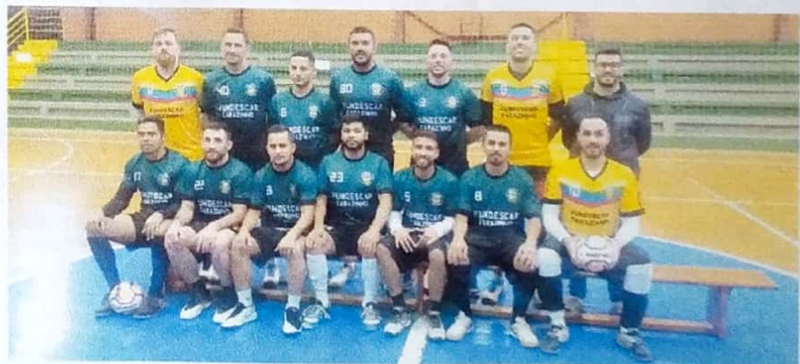
Atletas que estão treinando com a Fundescar atualmente